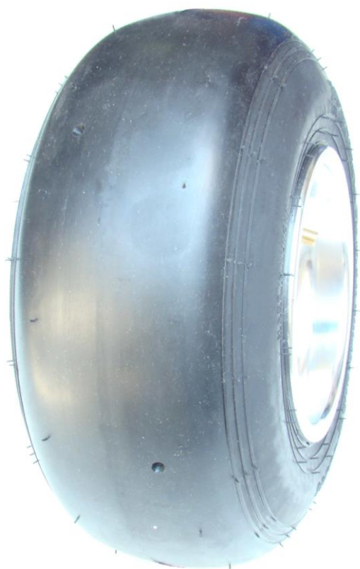
FOTO DEL PNEUMATICO MONTATO